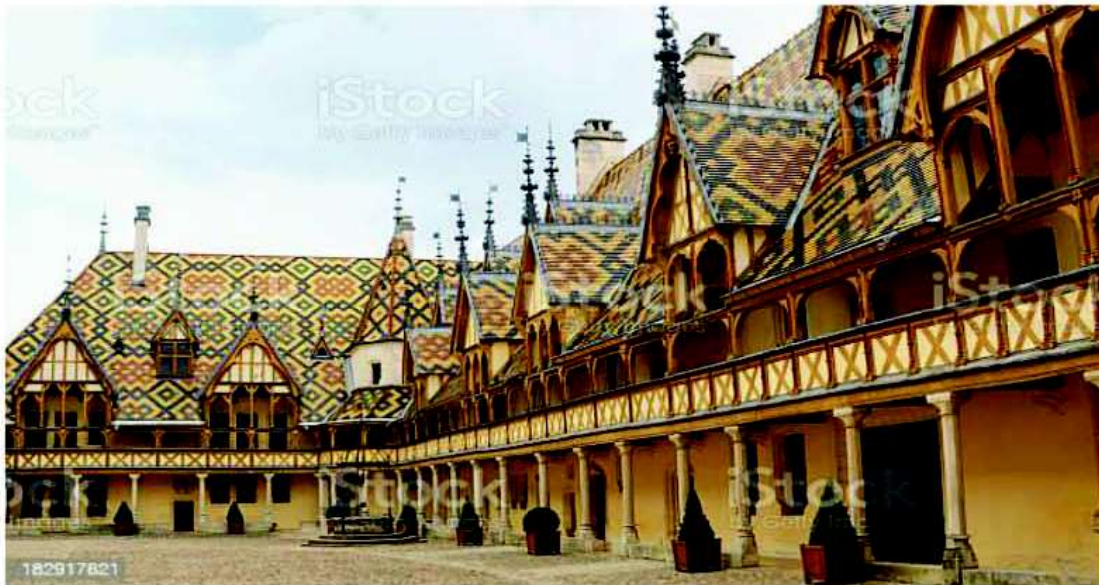
Hospices Civils de Beaune

Avec la Rando des Climats , Beaune Cyclos souhaite réunir et satisfaire le plus grand nombre de participants pour que ce rendez-vous sportif et culturel devienne incontournable.